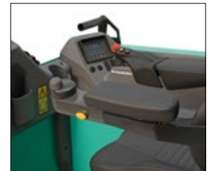
Mini-Lenkrad mit frei beweglicher Armlehne